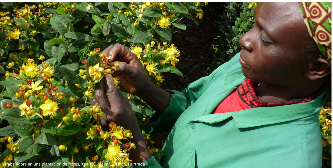
Trabajadora en una plantación de flores, Kenia

Este documento responde a la necesidad de un marco claro que oriente las afirmaciones que se hagan sobre los salarios vitales. Tiene dos propósitos principales: en primer lugar, guiar a quienes deseen hacer afirmaciones para que lo hagan de manera reflexiva, sensata y basada en evidencias; y en segundo lugar, promover la comprensión y el conocimiento sobre lo que hace que las afirmaciones sean creíbles. Al desarrollar este documento, nuestra intención no es promover la realización de más afirmaciones. De hecho, el primer paso de este proceso es determinar si hay necesidad de realizar afirmación alguna. Sin embargo, cuando las empresas o los sistemas de sostenibilidad necesiten hacer afirmaciones, esperamos que utilicen este marco para guiar sus reflexiones y garantizar que las afirmaciones sean creíbles, claras y relevantes.