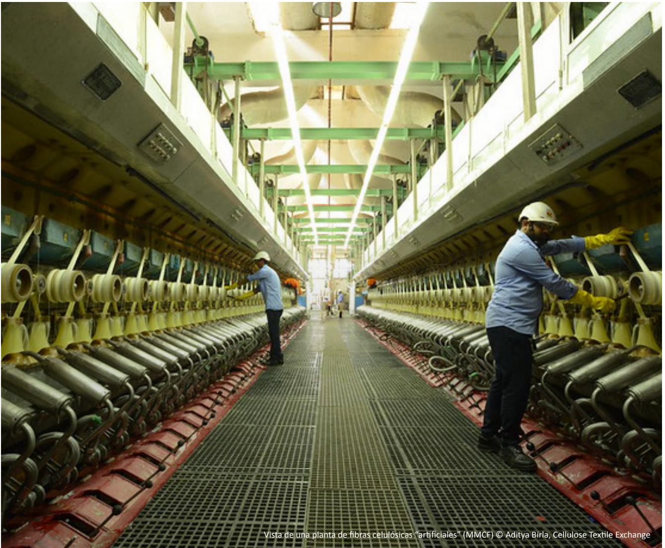
Vista de una planta de fibras celulósicas "artificiales" (MMCF)

El sistema que sustenta una afirmación puede incluir un mecanismo de monitoreo que genere datos y evidencia para respaldar las afirmaciones. Esto puede ampliarse para incluir un sistema sólido para controlar las afirmaciones, con diversos controles que verifiquen las afirmaciones realizadas públicamente y evitar aquellas que sean engañosas.