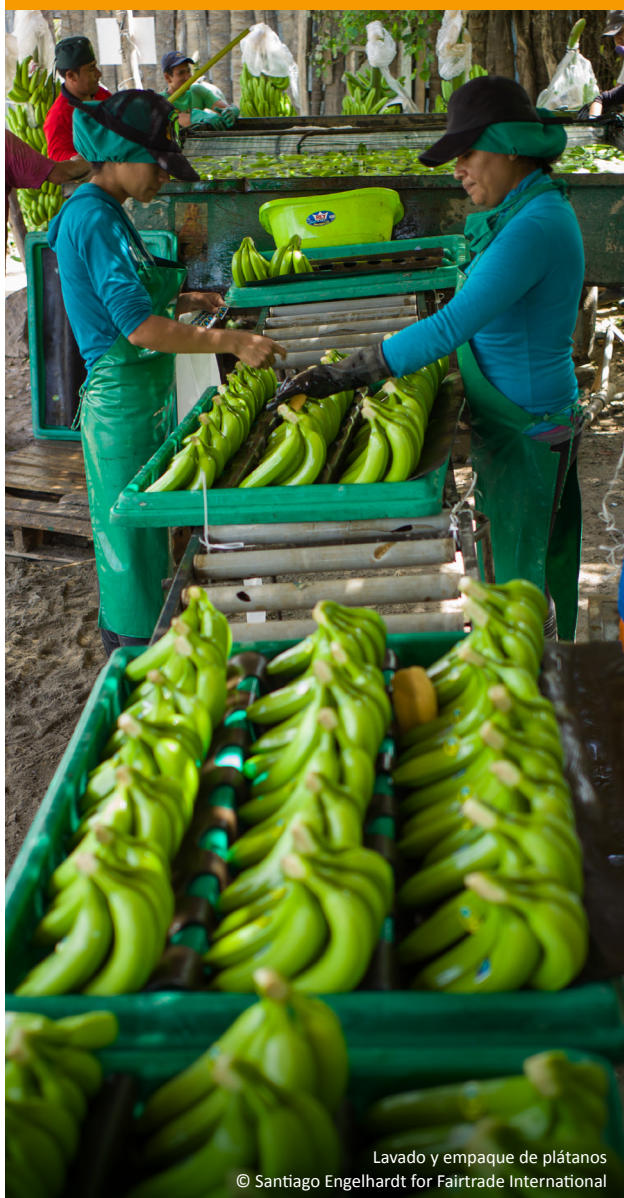
Lavado y empaque de plátanos