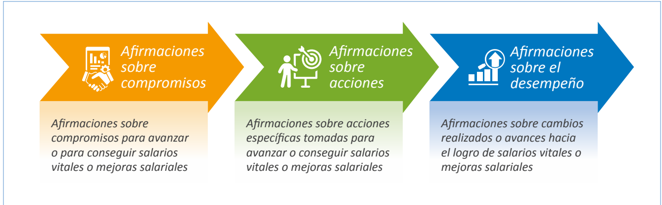
Figura 2: Una tipología de afirmaciones sobre salarios vitales: afirmaciones sobre compromisos, afirmaciones sobre acciones y afirmaciones sobre el desempeño.

1. Las afirmaciones sobre compromisos son afirmaciones sobre los compromisos asumidos para avanzar o para conseguir salarios vitales y mejoras salariales. Por ej.: “Nos comprometemos a que el 75% de los trabajadores de nuestra cadena de suministro de bananas ganen un salario vital para 2025 y que sean el 100% para 2027”.